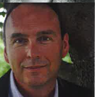
François Legault, Administrateur